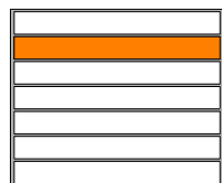
SCHÉMA PODLAŽIA: 6.NP