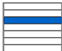
SCHÉMA PODLAŽIA: 5.NP